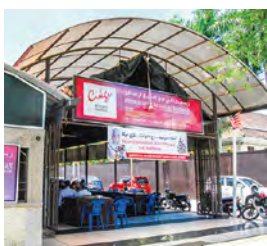
Cikgu Nasi Ulam Jalan Hilir Kota, Kampung Kraftangan, 15300 Kota Bharu, Kelantan, Malaysia. 営業時間: 11:00~16:45

は精製時に加える水の量が少ないため、ナンプラーなどに比べると濃度が高く、とろっとしています。イタリアンでよく使われるアンチョビをそのまますりつぶしたような味で、濃い塩気と独特な魚の匂いが特徴。塩辛にも似ています。食べ方は、生野菜や焼き魚につけたり、白いご飯に少し垂らしたり。醤油に近い食べ方です。