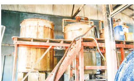
樽で熟成した液体に4時間ほど火を入れ、これを濾したらブドウは完成。とろとした口あたりを大事にしているため、あまり細かく濾すことはしていません

■あなたにとつてのブドウはなんですか。それを見つけて、それを大事にしていきたい。ブドウの匂いを思い出しながら、そんなことを考えています。