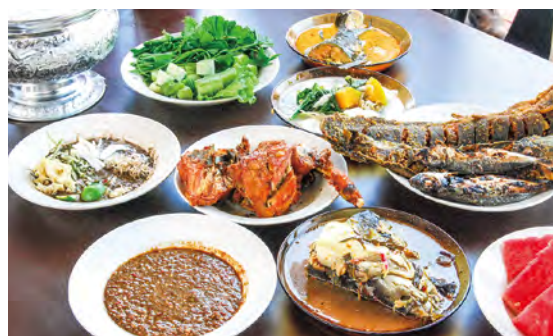
オーダーの例。ブドウは左中央と手前。野菜や揚げ魚をつけて食べる。ブドウは野菜と一緒に食べるのが多いので、ときにトレンガヌと表現されることもあるが、野菜全体にかけるとは全く醤油に近い

■クランタン州・コタバルでブドウを味わえる「Cikgu Nasi Ulam (チエグ・ナシ・ウラム)」。炭火焼の魚や生野菜のつけダレとして、ブドウがかならず提供されます。ブドウはそのまま食べてもいいし、レモンガラス、玉葱、きゅうり、ライム、ミョウガに似ているブンガカントラン(生姜の花)を混ぜてもおいしいです(右の写真参照)。お好みで、「トンポヤ」という発酵ドリアンを加えることも。6ヶ月〜1年ほど密閉保存したドリアンで、味は生のドリアンよりもまろやか。でも匂いはしっかりドリアン。魚臭いブドウに、臭いの王様ドリアンを混ぜるという、なんとも強烈なアレですが、暑いマレーシアの気候にはぴったりで、食欲をかきたてます。クランタン州の王様も最良というこの店で、伝統の味をぜひ味わってみてください。