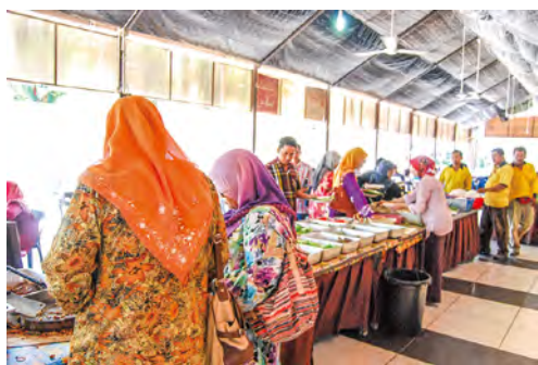
地元のマレーシア人できわつ有名店広い店内だがランチタイムは毎日ほぼ満席になる