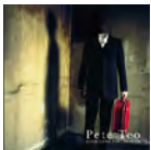
"Rustic Living For Urbanites" 2003 Redbag Music

シンガーソングライター、俳優、プロデューサー マレーシア・サバ州、コタキナバル生まれ