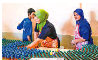
ブドウの瓶詰作業は、スタッフによる手作業。 塩気の強いブドウは小瓶サイズが主流