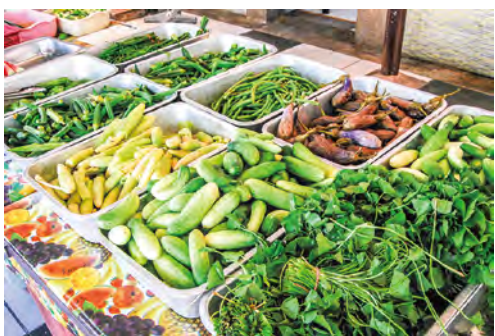
地元採れる野菜。小さなキュウリ、長いインゲン豆、豆の長い葉など、日本では見たことのない野菜が多い