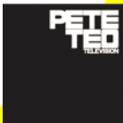
"TELEVISION" 2006 Redbag Music